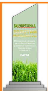
ГОЛУБ ГЕННАДІЙ АНАТОЛІЙОВИЧ