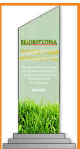
ЖЕЛЄЗНА ТЕТЯНА АНАТОЛІЙВНА