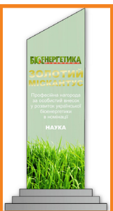
РОІК МИКОЛА ВОЛОДИМИРОВИЧ