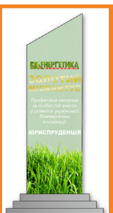
ДОМБРОВСЬКИЙ ОЛЕКСАНДР ГЕОРГІЙОВИЧ