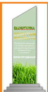
ГЕЛЕТУКА ГЕОРГІЙ ГЕОРГІЙОВИЧ