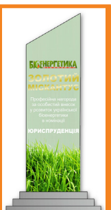
САВЧУК СЕРГІЙ ДМИТРОВИЧ