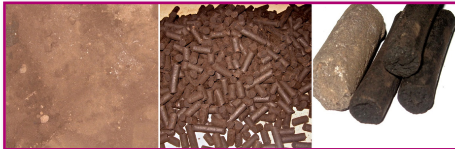
Рис.2. а) исходное сырье — гидролизный лигнин; б) готовые гранулы; в) готовые гранулы (крупный масштаб).

2.2.1. Сушка микроизмельчённой биомассы. Принципиальным отличием процесса сушки в случае нового технологического подхода становится то обстоятельство, что при микроизмельчении биомассы до размеров частиц \leq 100 мкм полностью разрушается макрокапиллярная структура исходного капил-