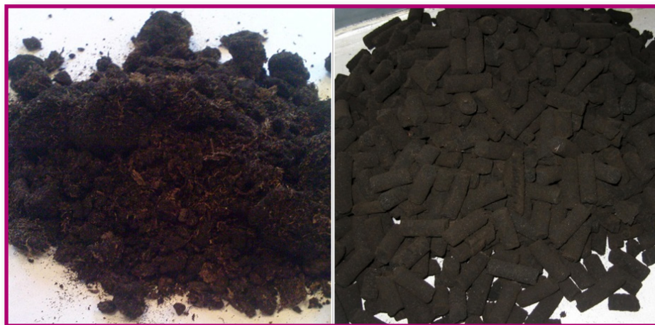
Рис.3. а) исходное сырье — торф; б) гранулы.