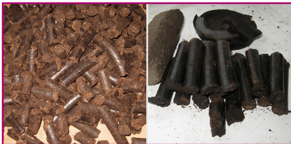
Рис.5. Гранулы из растительных отходов, образующихся при уборке подсолнечника.