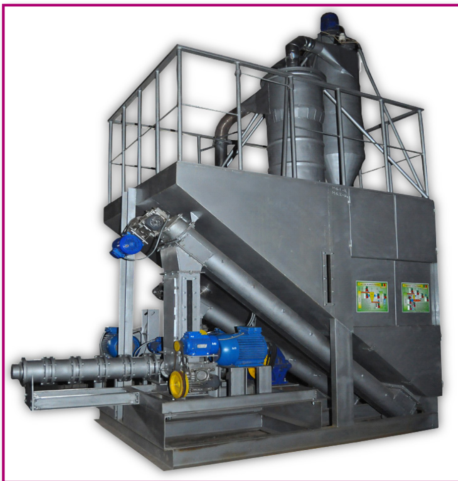
Рис.1. Опытный образец технологической линии гранулирования биомассы

В процесс разработки технологий гранулирования биомассы с целью получения топлива исторически использовались технологические подходы, аналогичные производству гранулированных кормов. Однако прямой механический перенос «кормовой» техноло-