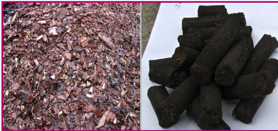
Рис. 6. а) исходное сырье — кора хвойных пород древесины; б) готовые гранулы

Оценка качества полученных гранул показала следующие результаты: 1) насыпная плотность — 800–850