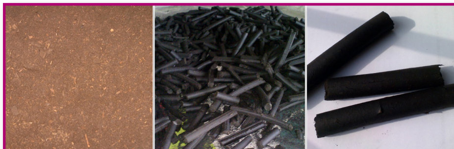
Рис.4. а) исходное сырье — компост; б, в) готовая гранула.

2.4.1. Стабилизация сформированной структуры гранул путем снижения их температуры при минимальных нарушениях сформированной структуры. Снижение температуры гранулированной биомассы, как указывалось выше, ведёт к изменению релаксационных состояний биополимерных компонентов материала и приводит их в твердое фазовое состояние. Важным соображением, определяющим динамику технологического процесса на этой стадии, является фазовое состояние воды, присутствующей во внутренней струк-